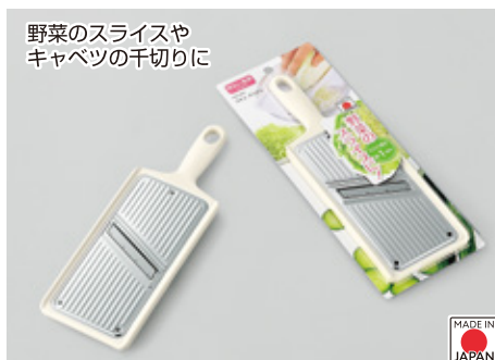
ASS-604 62190021002 味わい食房 ステンスライス

小売価格 750円 ●入数: 60 (10×6) ●JANコード: 4962336613308 ●材質: 刃部/ステンレス刃物鋼、樹脂部/ABS樹脂