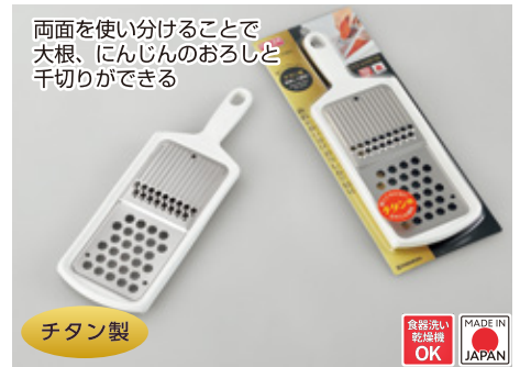
ATO-743 62366211002 味わい食房 チタンおろし・千切り

小売価格 1,500円 ●入数: 60 (10×6) ●JANコード: 4962336614817 ●材質: 刃部/チタン、樹脂部/ポリプロピレン