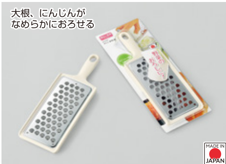
ASO-603 62190011002 味わい食房 ステンおろし器

小売価格 800円 ●入数: 60 (12×5) ●JANコード: 4962336609127 ●材質: アルミニウム