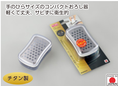
ATT-744 62367011002 味わい食房 チタン手のひらおろし

小売価格 1,500円 ●入数: 60 (10×6) ●JANコード: 4962336614831 ●材質: 刃部/チタン、樹脂部/ポリプロピレン