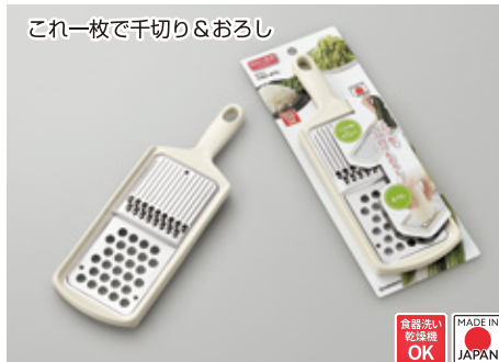
ASO-721 62195111002 味わい食房 ステン千切り・おろし

小売価格 900円 ●入数: 60 (12×5) ●JANコード: 4962336606218 ●材質: 刃部/ステンレス鋼、樹脂部/ABS樹脂