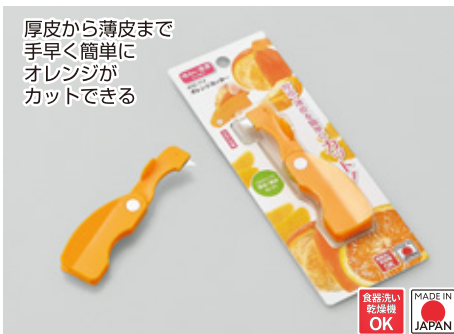
AOC-714 61791091002 味わい食房 オレンジカッター

小売価格 450円 ●入数: 60 (10×6) ●JANコード: 4962336613223 ●材質: カッター刃/ステンレス刃物鋼、本体/ポリプロピレン