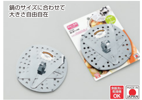
AFO-629 50121041002 味わい食房 落とし蓋フック付

小売価格 1,000円 ●入数: 100 (10×10) ●JANコード: 4962336210170 ●材質: 金属部/ステンレス鋼 ハンドル/ポリプロピレン(耐熱温度: 110度)