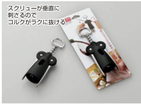
AWO-726 62126011002 味わい食房 ワインオープナー

小売価格 1,200円 ●入数: 60 (10×6) ●JANコード: 4962336614404 ●材質: 金属部/亜鉛合金(クロムメッキ) スクリュー/炭素鋼(クロムメッキ)、本体/ABS樹脂(シリコン塗装)