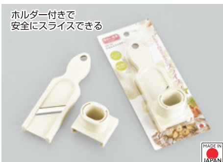
ANS-700 61750111002 味わい食房 にんにくスライサー

小売価格 480円 ●入数: 60 (12×5) ●JANコード: 4962336606416 ●材質: 刃部/ステンレス刃物鋼、樹脂部/ABS樹脂