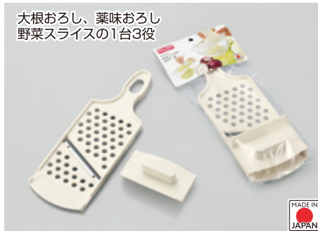
AOS-612 61731011002 味わい食房 おろしスライサー

小売価格 1,500円 ●入数: 60 (10×6) ●JANコード: 4962336614848 ●材質: 刃部/チタン、本体/ポリプロピレン フタ・容器/AS樹脂、すべり止め/ゴム