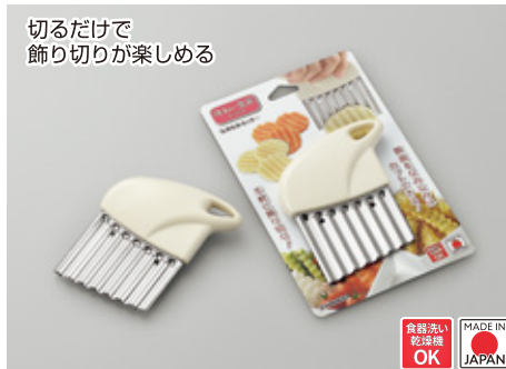
ANC-731 60392011002 味わい食房 なみなみカッター

小売価格 600円 ●入数: 120 (12×10) ●JANコード: 4962336210880 ●材質: 金属部/ステンレス鋼、ハンドル/ポリプロピレン