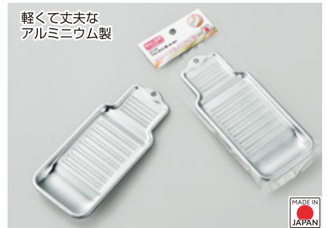
AAO-668 63220011002 味わい食房 アルミオロシ器(粗目・細目)

小売価格 530円 ●入数: 60 (12×5) ●JANコード: 4962336606430 ●材質: 刃部/ステンレス刃物鋼、樹脂部・ホルダー/ポリスチレン