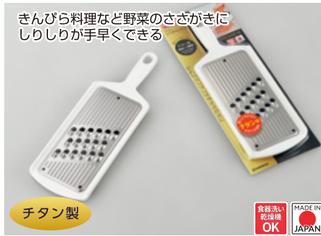
ATF-741 62365011002 味わい食房 チタン太千切りしりしり

小売価格 1,500円 ●入数: 60 (10×6) ●JANコード: 4962336614817 ●材質: 刃部/チタン、樹脂部/ポリプロピレン