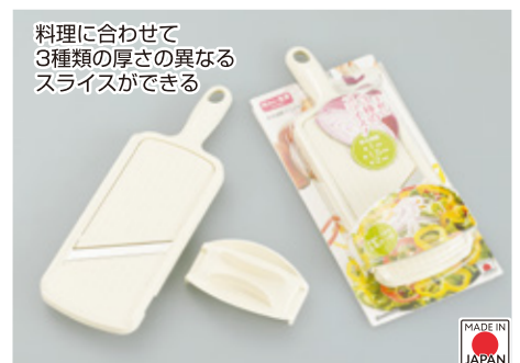
AAS-706 63960111002 味わい食房 厚み調整スライサー

小売価格 1,100円 ●入数: 60 (12×5) ●JANコード: 4962336606225 ●材質: 刃部/ステンレス鋼、樹脂部/ABS樹脂