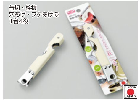
ABO-621 62122011002 味わい食房 栓抜・缶切

小売価格 1,200円 ●入数: 60 (10×6) ●JANコード: 4962336614404 ●材質: 金属部/亜鉛合金(クロムメッキ) スクリュー/炭素鋼(クロムメッキ)、本体/ABS樹脂(シリコン塗装)