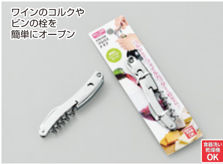
ASN-638 28910011002 味わい食房 ソムリエナイフ

小売価格 650円 ●入数: 120 (12×10) ●JANコード: 4962336606775 ●材質: 本体/普通鋼(メラミン焼付塗装) 刃部/炭素鋼(クロムメッキ)