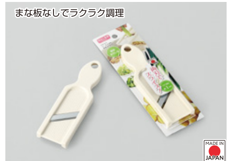
AMS-610 61582011002 味わい食房 ミニスライサー

小売価格 900円 ●入数: 60 (12×5) ●JANコード: 4962336614350 ●材質: 刃部/ステンレス鋼、樹脂部/ポリプロピレン