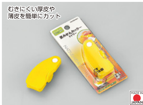
ANM-641 61790051002 味わい食房 夏みかんカッター

小売価格 450円 ●入数: 60 (10×6) ●JANコード: 4962336613223 ●材質: カッター刃/ステンレス刃物鋼、本体/ポリプロピレン