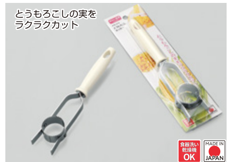
ATK-213 27020011002 味わい食房 とうもろこしカッター

小売価格 450円 ●入数: 120 (12×10) ●JANコード: 4962336607765 ●材質: 刃部/ステンレス鋼、本体/ポリプロピレン