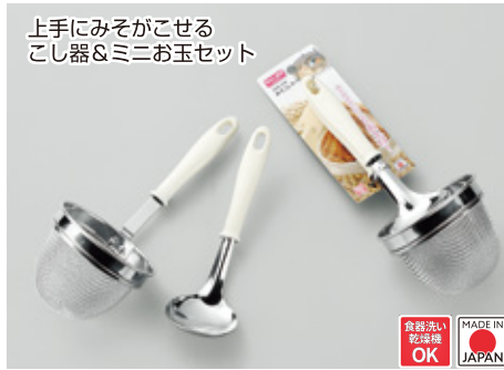
AMS-628 26344531002 味わい食房 みそこしセット

小売価格 1,300円 ●入数: 120 (12×10) ●JANコード: 4962336607680 ●材質: ステンレス鋼