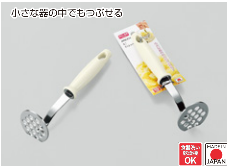
APM-214 27021011002 味わい食房 ミニマッシャー

小売価格 1,200円 ●入数: 50 (10×5) ●JANコード: 4962336500417 ●材質: ステンレス鋼